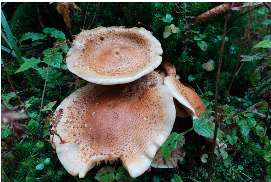
Abb.: Das Totholz des Bödmerenwaldes ist ein Eldorado für Pilze.

Neben beeindruckenden Felsformationen und uralten Baumriesen bot der Wald auch Einblick in das empfindliche Gleichgewicht von Werden und Vergehen: Pilze, in erstaunlicher Vielfalt sichtbar, spielen dabei eine zentrale Rolle. Ein botanisches Highlight war der Fund der Engelshaarflechte, eine äusserst seltene Art, die schweizweit nur an drei Standorten vorkommt – ein unauffälliger, aber eindrucksvoller Zeuge unberührter Natur.