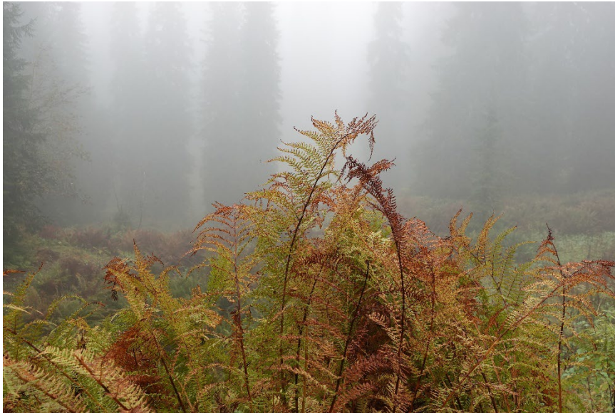
Abb.: Der Bödmerenwald zeigt sich aufgrund seiner Lage häufig vor einer nebligen Kulisse, die ihm umso mehr einen mystischen Charakter verleiht.

Am 27. September 2025 begaben sich Mitglieder der SGNW auf eine ganz besondere Entdeckungsreise: eine geführte Tour in den sagenumwobenen Bödmerenwald im Muotathal – einem der urtümlichsten Wälder der Schweiz.