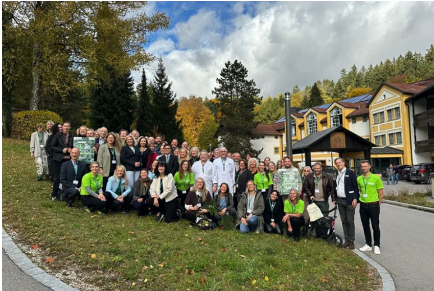
Abb.: 1. Wartenberger Waldtherapie Kongress. Der erste Waldtherapiekongress in Wartenberg war ein voller Erfolg.

Neben dem fachlichen Austausch trug auch das Rahmenprogramm zur besonderen Atmosphäre bei. Die Teilnehmenden wurden kulinarisch verwöhnt, und ein gemeinsamer Abend beim bayrischen Bier bot Gelegenheit zu vertiefenden Gesprächen zwischen Kongressteilnehmenden und Dozierenden. Die Präsenz vor Ort bot der SGNW die Möglichkeit, sich über die Landesgrenzen hinaus bekannt zu machen. Auch ein Vertreter der Gesundheitskasse AOK Bayern war vor Ort. In vielen persönlichen Begegnungen konnten neue Kontakte geknüpft werden.