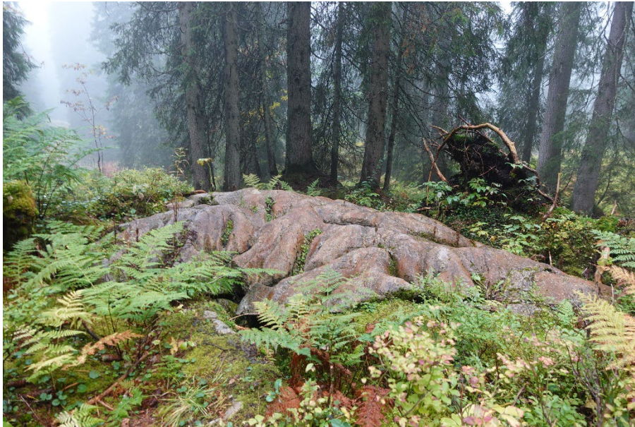
Abb.: Kalksteine schufen über Jahrtausende hinweg ein riesiges Höhlensystem, das sich unterhalb des Bödmerenwalds kilometerweit ausbreitet.

Neben beeindruckenden Felsformationen und uralten Baumriesen bot der Wald auch Einblick in das empfindliche Gleichgewicht von Werden und Vergehen: Pilze, in erstaunlicher Vielfalt sichtbar, spielen dabei eine zentrale Rolle. Ein botanisches Highlight war der Fund der Engelshaarflechte, eine äusserst seltene Art, die schweizweit nur an drei Standorten vorkommt – ein unauffälliger, aber eindrucksvoller Zeuge unberührter Natur.