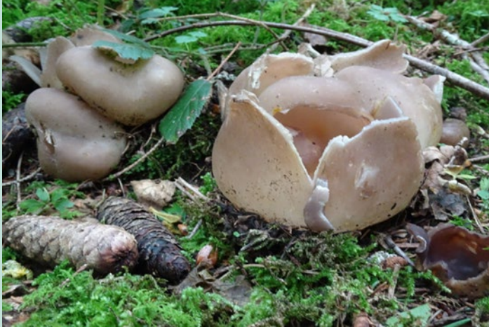
Sarcosphaera coronaria – Violetter Kronenbecherling

Auflösung aus dem Newsletter September 2025