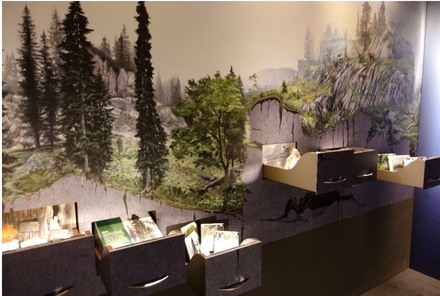
Abb.: Der Urwaldpavillon präsentiert auf interaktive Weise ein riesiges Wissen über das Urwaldreservat Bödmerenwald.

Auf der Rückfahrt erlebte die Gruppe eine weitere Überraschung: Der Alpbazug mit bunt geschmückten Kühen, dem Geläut der Trycheln und den traditionell gekleideten Sennen liessen die Mitglieder eintauchen in die lebendige Tradition der Muothtaler – ein authentisches Stück Schweiz zum Mit(er)leben.