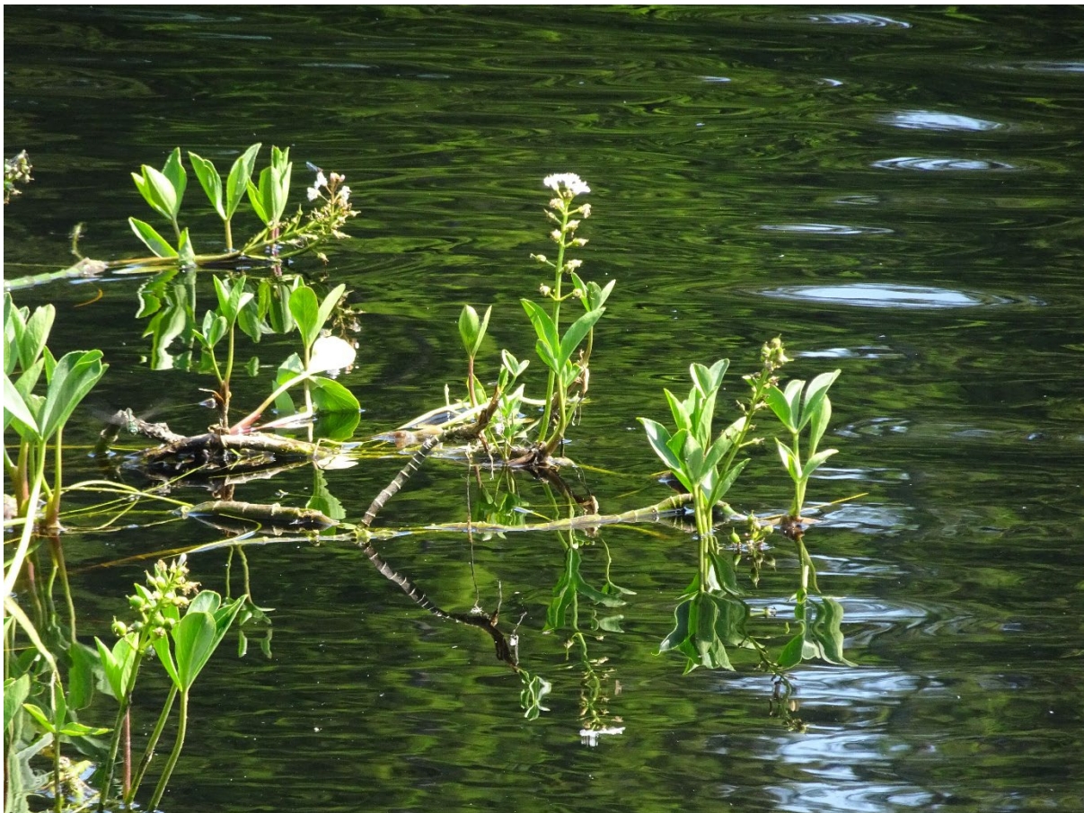
Abb.: Die Pflanze schwimmt auf dem Wasser.

Die Vermehrung des Fieberklees findet im Untergrund über ein bis zu zwei Meter langes Rhizom statt, das ein dichtes Wurzelgeflecht bildet. Dadurch kann die Pflanze auch bis in Gewässer hineinwachsen. Um unter diesen Umständen überleben zu können, hat der Fieberklee ein paar wichtige Besonderheiten entwickelt. Die Blätter und Stängel sind hohl und mit Luft gefüllt, um der Pflanze Auftrieb im Wasser zu geben, damit sie nicht untergeht [4].