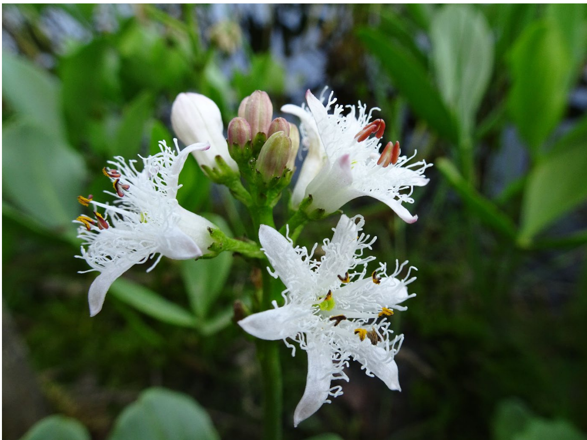
Abb.: Blüte des Fieberkleees

Diejenigen des Fieberkleees sind jedoch um einiges grösser. Entgegen der Vermutung sind die beiden Arten aber nicht miteinander verwandt [4]. Es sind aber nicht die Blätter oder die bescheidene Grösse von 15 bis 30 cm der Pflanze, die bestechen, sondern die vielen weissen, teilweise rötlichen Blüten [1]. Diese faszinieren mit ihren fünf Zipfeln, welche mit filigranen Haaren verziert sind [1, 4].