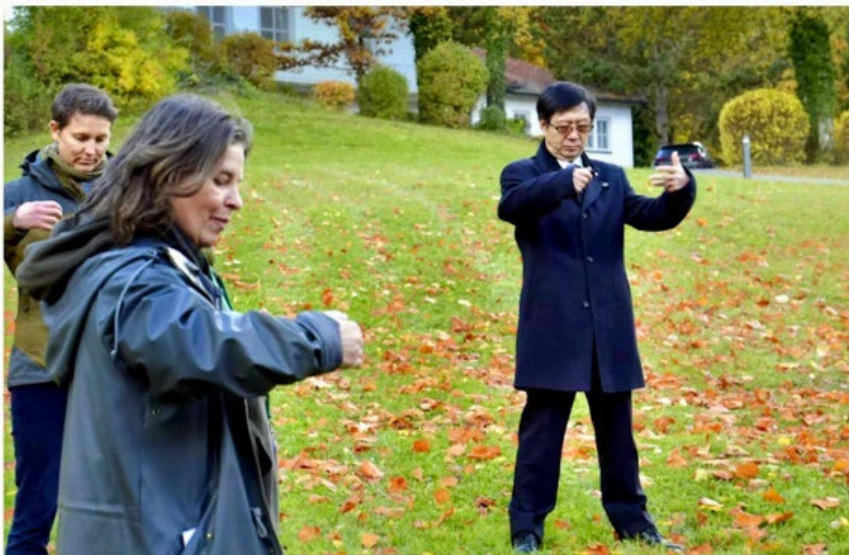
Abb.: An den Übungen nimmt auch Qing Li von der Nippon Medical School in Tokio teil, der als Begründer der Waldtherapie gilt.

Der zweite Tag stand im Zeichen der Praxis. Auf dem Waldtherapiepfad und im angrenzenden Waldpark wurden waldtherapeutische Ansätze in angeleiteten Sequenzen erlebbar gemacht. Die Verbindung von Theorie, Selbsterfahrung und fachlicher Begleitung verdeutlichte den Wald als wirksamen therapeutischen Raum, auch im rehabilitativen Kontext.